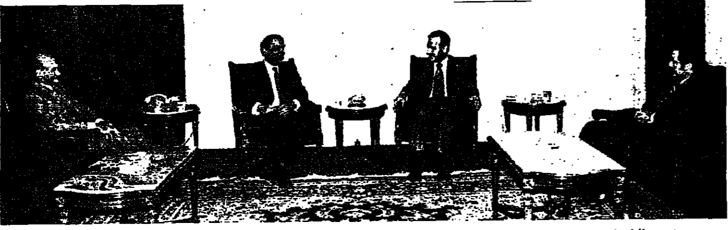
الرئيس سركيس والأمين العام في المباحثات أمس

كتب فوزي مبارك: عاد الرئيس ياسين سركيس الى بيروت بعد ظهر امس، مطمئناً الى نتائج محادثاته مع الرئيس حافظ الأسد وبلغ رئيسي المجلس والحكومة والوزراء الذين كانوا في استقباله ان خطوات عملية ملموسة ستظهر على سبيل المثال في المناطق التي تم تحريرها وخاصة مشكلة الجنوب. ولم يصدر بيان مشترك عن المباحثات كما كان مقرراً، وكذلك لم يقدّم مؤتمر صحفي مشترك للرئيسين، بسبب ضيق الوقت وانصراف الأردنيين الى انظار وقت غير متيسر الى حين انتهاء الجلسة الاضرة من المباحثات. ولكن الرئيس الأسد ابلغ الصحفيين بعدما ودع ضيفه الرئيس اللبناني: استطاع جميعاً الى ان انتهى كل التنازلات بشأن الجنوب، وبالتعاون مع جميع الاخوان، ونأمل ان يسير كل شيء على ما يرام.